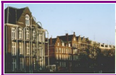
Typische Häuserzeile in Amsterdam

Im Reichsmuseum findet man eine umfangreiche Sammlung Niederländischer Kunst, angefangen bei frühen religiösen Werken bis hin zu Gemälden aus dem „Goldenen Zeitalter“ wie Rembrandts „Nachtwache“. Das Rijksmuseum ist das niederländische Nationalmuseum und befindet sich am Museumplein. Ca. 8.000 Kunstobjekte kann man hier bestaunen.